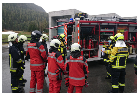
Unser Nachwuchs, ob in den Basis- oder Kaderkursen, ist top motiviert und zeigt sehr gute Leistungen.

Weiter konnten drei Gruppenführerkurse, ein Offizierskurs, der technische Hilfeleistungskurs sowie der Maschinistendienstkurs erfolgreich durchgeführt werden.